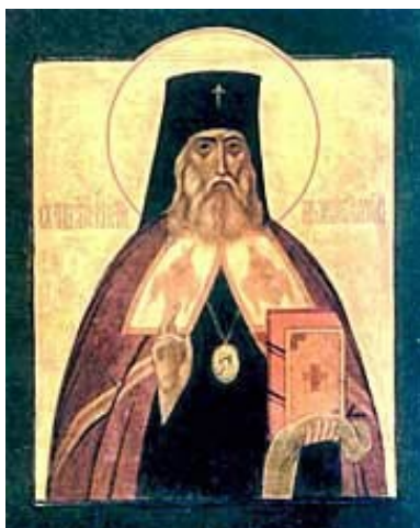
亜使徒日本の大主教聖ニコライ

誰れか齋して勞せしならば、今銀一枚を取るべし。 … 齋せし者及び齋せざりし者は今日楽しむ。